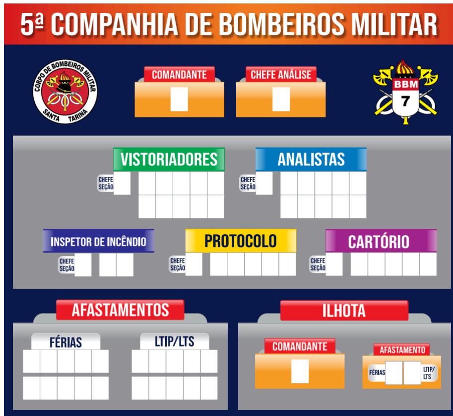
8.6.7. Modelo quadro 3: