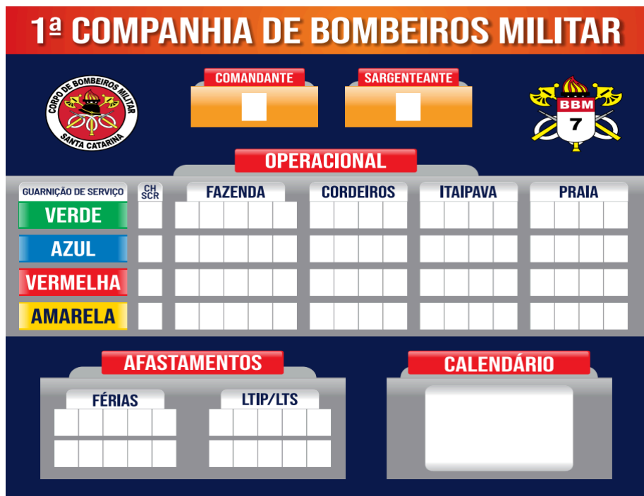
8.6.6. Modelo quadro 2: